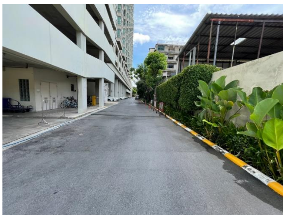
รูปที่ 1.4-1 แสดงสถานภาพปัจจุบันของโครงการ (เดือนมิถุนายน 2565)